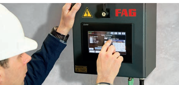
Affichage sur l'écran tactile