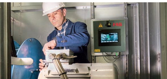
Surveillance en ligne du moteur et du ventilateur