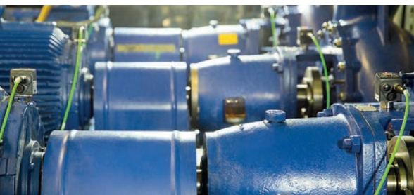
Surveillance en ligne de moteurs et de pompes